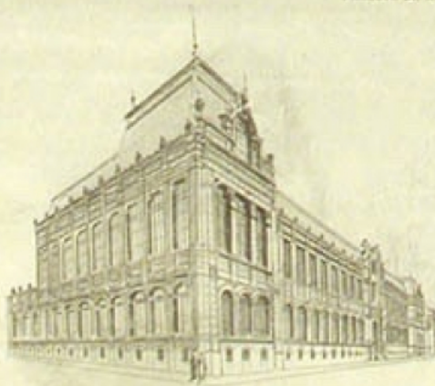
FACULTÉ DES SCIENCES. — INSTITUT DE CHIMIE.

Le ministre a répondu en remerciant le personnel et les élèves, et en leur donnant quelques paroles d'encouragement. Après un chœur exécuté par les élèves