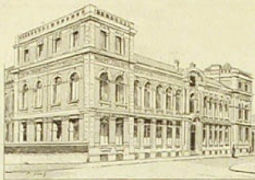
FACULTÉ DES SCIENCES. — INSTITUT DE PHYSIQUE.

L'adjudication des travaux de la nouvelle université a eu lieu en décembre 1894 : les travaux ont commencé au prin-