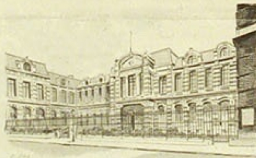
FACULTÉ DE MÉDECINE. — INSTITUT DE PHARMACIE.

La place sur laquelle s'élève l'arc de triomphe érigé en l'honneur de l'entrée de Louis XIV à Lille et qui vient d'être