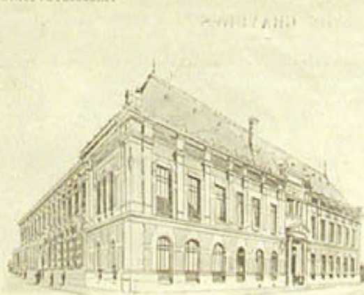
FACULTÉ DES SCIENCES. — INSTITUT D'HISTOIRE NATURELLE.