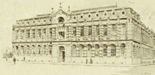
FACULTÉ DE MÉDECINE. — INSTITUT DE MATHÉMATIQUES.

belges ; ce qui n'a rien que de naturel, étant données les relations de Lille avec Bruxelles ou Gand. Mais aussi des professeurs de Genève et de Lausanne, de Groningue et d'Upsal, de Christiania, d'Oxford et de Glasgow ; beaucoup de Roumains, et même un professeur de Toronto. Des invitations acceptées de si loin prouvent le bon renom de l'hospitalité lilloise, et aussi celui de nos études.