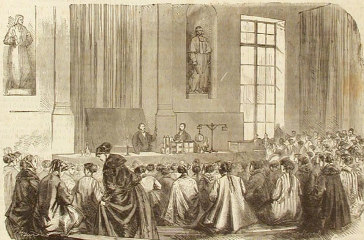
LE COURS D'ENSEIGNEMENT SECONDAIRE POUR LES JEUNES FILLES, A LA SORBONNE. — LEÇON DE CHIMIE. — (Voir page 440.)

ABONNEMENT Un an. Six mois. 10 centimes Paris. . . 5 fr. 50 3 fr. . le Départem*. 6 fr. 50 3 fr. 50 numéro.