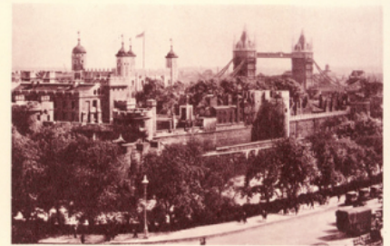
La vieille citadelle de la Tour de Londres. Bnf. Girault