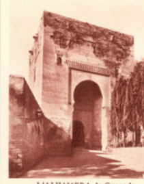
L'ALHAMBRA de Grenade reprise aux Musulmans en 1492