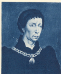
CHARLES le TEMERAIRE duc de Bourgogne (1433-1477)