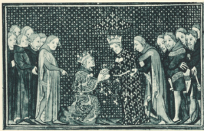
Edouard III d'Angleterre rendant hommage à Philippe VI de Valois. (manuscrit du XIV e s. conservé à la Bibliothèque Nationale)