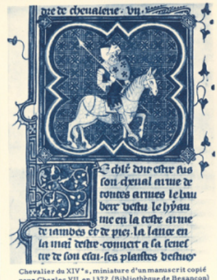
Chevalier du XIV e s., miniature d'un manuscrit copié pour Charles VII en 1372. (Bibliothèque de Besançon) Arc. Phot.