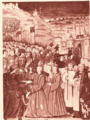
Entrée de Charles VII dans la ville de Rouen reconquise, au mois de novembre 1449.