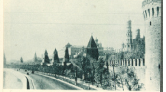
Le Kremlin (forteresse) de Moscou. Cl. Kevine résidence des tsars dès le XV e siècle.