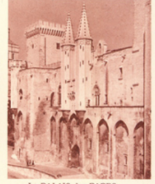
Le PALAIS des PAPES à Avignon. Arc. Phot.