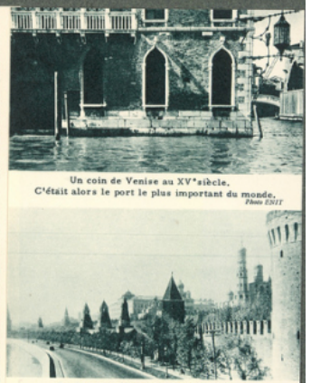
Un coin de Venise au XV e siècle. C'était alors le port le plus important du monde.