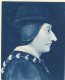
LOUIS XI roi de France de 1461 à 1483