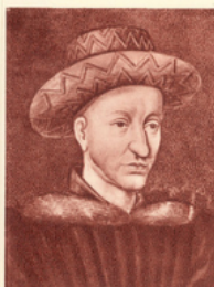
CHARLES VII roi de France de 1422 à 1461