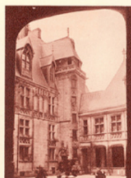
La maison de Jacques Cœur à Bourges.