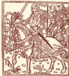
JEANNE D'ARC Gravure sur bois tirée de la "Mer des histoires" (1491) (Bibliothèque Nationale) Cl. BNF