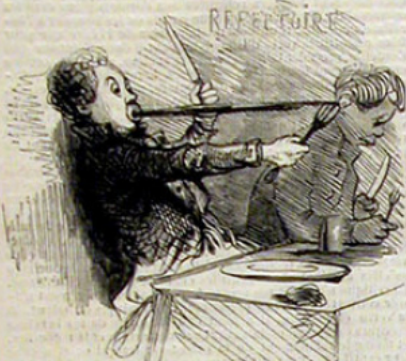
« Une nourriture saine et abondante. » — Extrait du prospectus.