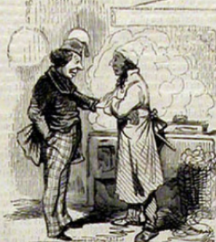
Si le poison est cher, il ne faut pas en acheter; je vais les flanquer tous au pain sec.