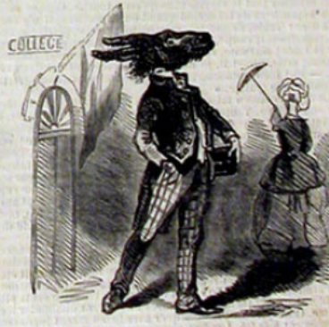
Sortie du collège.