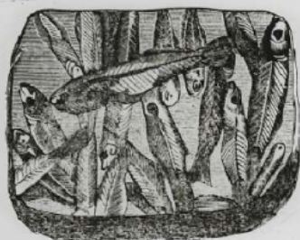
Fig. 358. — Poissons fossiles conservés sur une plaque de schiste.