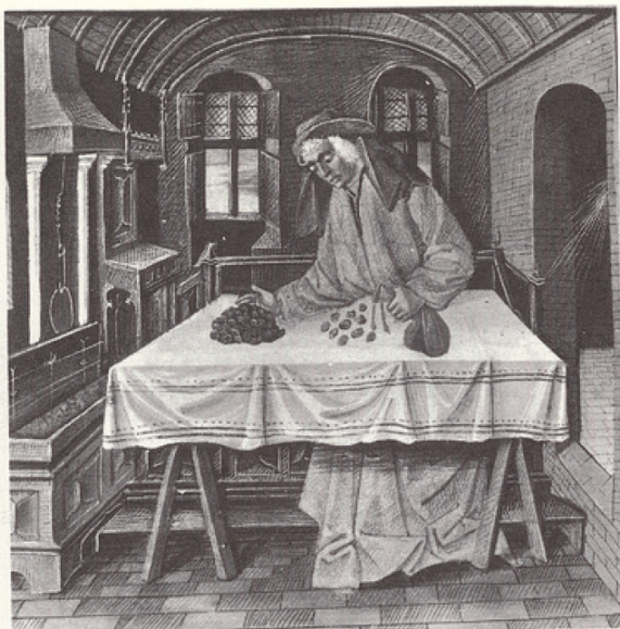
Le L'Avarice, vice de tous les temps. J. Le Grant, miniature du 15 e siècle. Collection Condé-Chantilly.