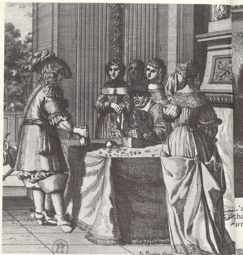
L'argent au XVII e siècle : L'usurier par Le Paultre.