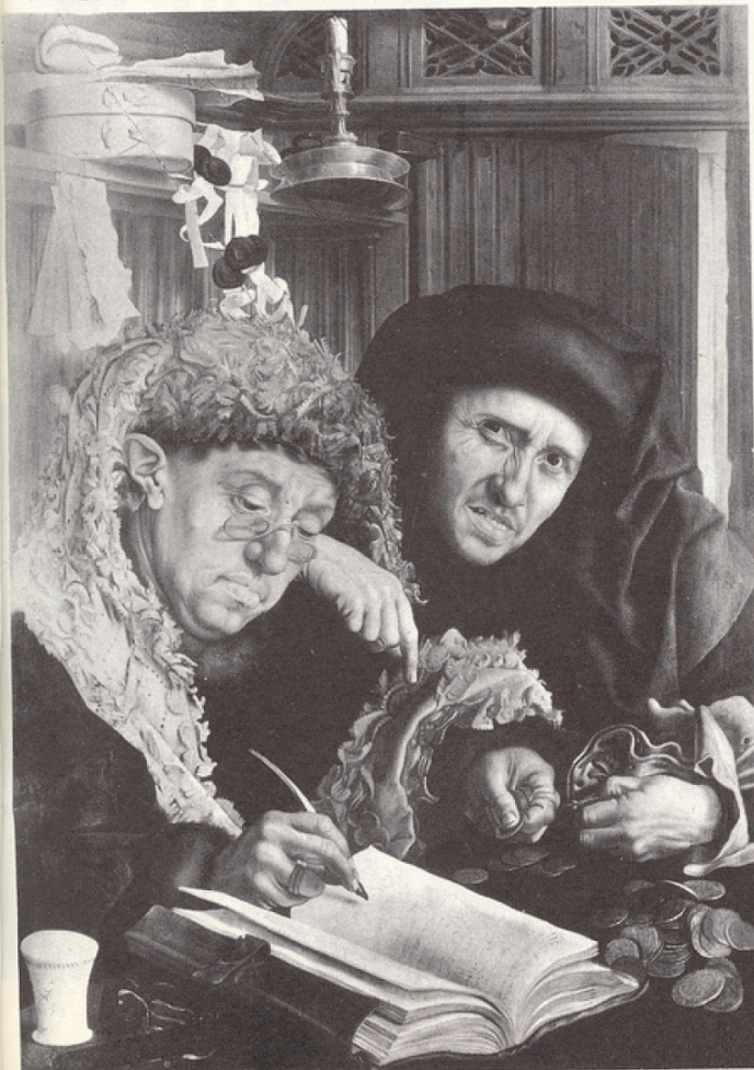
Les changeurs, par Quentin Matsys. Peinture du 16 e siècle.