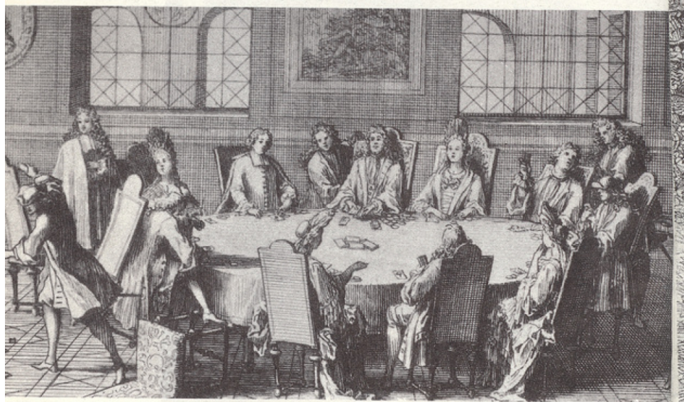
Le jeu au XVII e siècle : Le jeu de lansquenet par Sébastien Leclerc