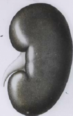
Fig. III. Rein sain.

Collection de l'Union française antialcoolique Soc. contre l'us. des bois. spirit. — PARIS, 5 r. de Pontoise.