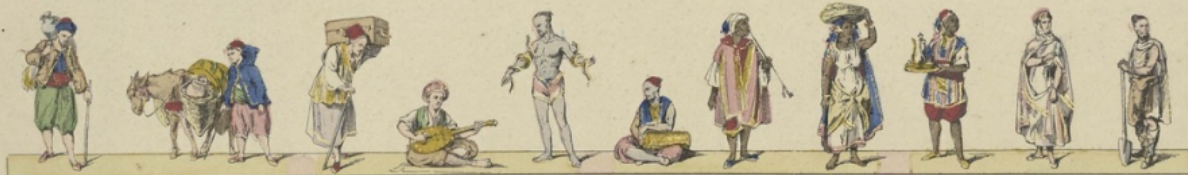
Pêcheurs de poissons. — Porteurs berbères. — Musicien arabe. — Aissoni (Charmer). — Maure. — Negre. — Negresse. — Domestique nègre. — Tunisien arabe. — Kabile.

L'Algérie située au nord de l'Afrique, est depuis 1830 une des plus belles possessions françaises; elle est bornée au nord par la Méditerranée, à l'ouest par l'empire du Maroc, à l'est par le royaume de Tunis, et au sud par le désert de Sahara. L'Algérie fut longtemps le repaire de pirates qui infestaient les mers et interrompaient le commerce des nations civilisées; et ce ne fut qu'en 1830 que la France, par la conquête d'Alger, fut maîtresse de toutes les pirateries qui venaient les Deyes depuis plusieurs siècles. — Alger qui est la capitale de l'Algérie, est une belle ville bâtie sur le versant d'une colline; son port est vaste, mais ses rues sont étroites et ses maisons terminées en terrasses; derrière d'une manière formidable du côté de la mer, elle s'étend dans le désert. Ses principaux édifices sont: le Palais de gouvernement, le Casbah ou citadelle qui renferme les trésors des Deyes. Les autres villes les plus remarquables sont: Biskah, Bougie, Oran, Constantine, etc. — Le sol de l'Algérie est très fertile et donne des productions végétales de toutes sortes. Ses principales sont: le raisin, le blé, l'orge, le lin, le chanvre, le tabac, la vigne, les oranges, les olives les figes, etc. On y rencontre quelques animaux remarquables, tels que: le Lion, le Panthère, le Hyène; mais depuis l'occupation française, les chasses fréquentes qu'il a fallu pour la destruction de ces animaux en ont diminué considérablement le nombre et les ont forcés à se retirer dans le désert.