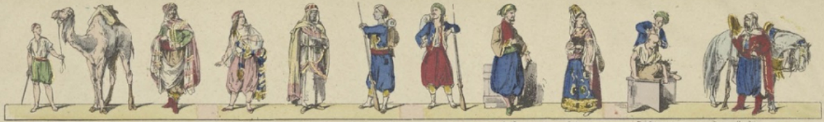
Chamelec. — Moors. — Mauresque. — Arabe. — Travailleurs Algériens. — Zouave. — Juif. — Juive. — Barbier. — Spahis.