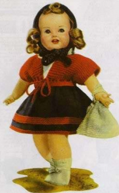
L'ENSEMBLE "CENDRILLON" SE COMPOSE D'UNE JUPE, D'UNE CHASUBLE ET D'UN PETIT BONNET.

10. Attache la laine bien serré et couds les deux brides. Le bonnet est terminé.