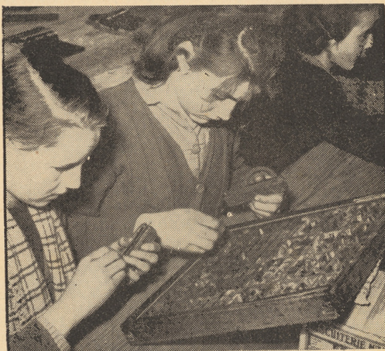
Composition d'un texte