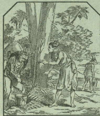
LA RÉCOLTE DU CAOUTCHOUC