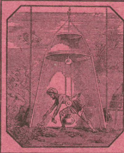
LE PÊCHEUR DE PERLES