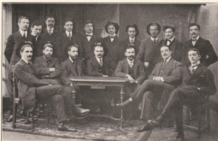
La commission du bal des Etudiants en 1911