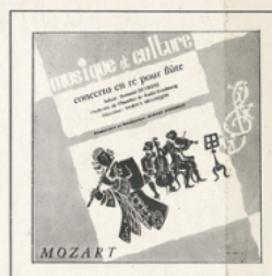
Concerto pour flûte (Mozart) ■ M C - 3002