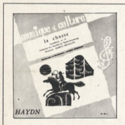
La Chasse (Haydn) ■ M C - 3001