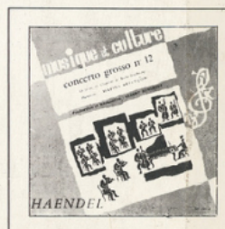
Concerto Grosso (Handel) ■ M C - 2504 DIPLOME DU MEILLEUR DISQUE LOISIRS-JEUNES