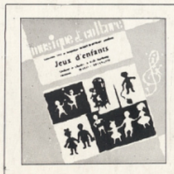
Jeux d'enfants (Bizet) ■ M C - 2503