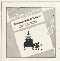
Divertissement en ré (Mozart) ■ M C - 2502 DIPLOME DU MEILLEUR DISQUE LOISIRS-JEUNES