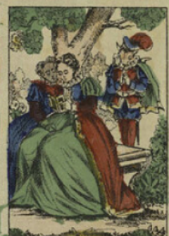
Pour comble d'infortune, il devint éperdument amoureux de la belle Ismène.