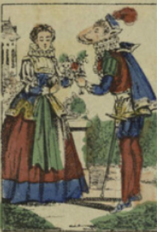
Il cherchait toutes les occasions de lui être agréable, et il lui offrait des fleurs et des bijoux.