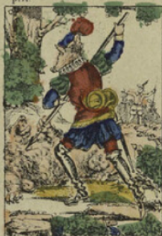
A la chasse, il était d'un courage à toute épreuve.