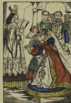
Le roi força la belle Ismène à épouser le prince Marcassin.