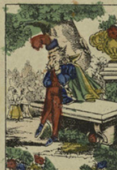
Mais, hélas! le souvenir de sa disgracieuse figure le plongeait dans un noir chagrin.