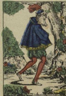
Dégoûté de la cour, le prince Marcassin veut vivre dans les bois avec les bêtes féroces.