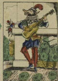
Il chantait fort bien en s'accompagnant de la guitare.