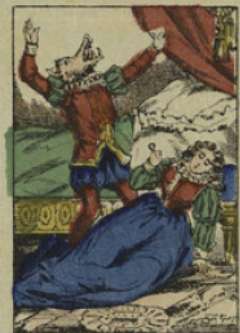
Ismène, le jour même des noces, se poignarda aux pieds de Marcassin.