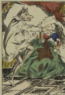
Zélonide, pour venger sa sœur Ismène, veut tuer Marcassin pendant son sommeil. Le prince, furieux, se jette sur elle et l'étrangle.