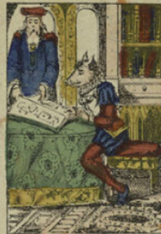
On lui donna des maîtres en tous genres, et il apprenait ce qu'il voulait.