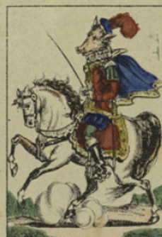
Personne ne l'égalait dans l'art de dresser les chevaux les plus fougueux.