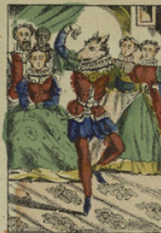
A la danse, il faisait merveille.