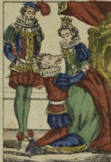
Le roi et la reine se consolèrent de la laideur de leur fils, parce qu'il avait beaucoup d'esprit.