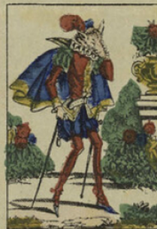
Alors, il devint si triste et si laid, que ses os perçaient sa peau.