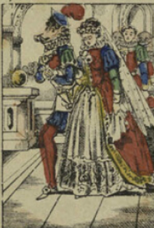
Quelque temps après, pour se consoler, Marcassin épousa Zélonide, sœur d'Ismène.