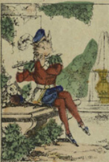
Il jouait en perfection de la flûte traversière.