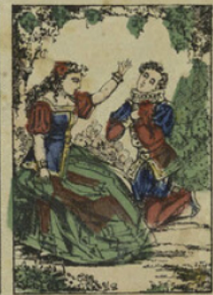
Aussitôt Marcassin devint le prince le plus beau qu'on puisse voir; ils retournèrent ensemble à la cour, et Marthésie devint reine.