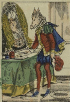
Mais le pauvre prince, en se regardant au miroir, voyait bien qu'il ne pouvait pas plaire à la belle.