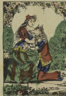
Enfin, la belle Marthésie consent à aimer le prince Marcassin.