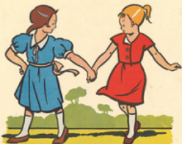
a line a u ne a mie ma rie