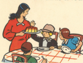
mè re a mè ne le re pas