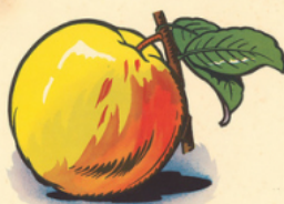
u ne po mme mû re