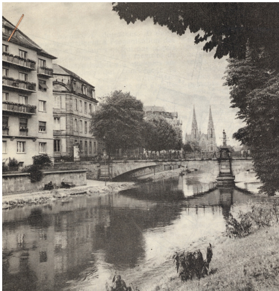
L'église Saint-Paul de Strasbourg.

Extrait de Education et Jesuits 209 - 1967