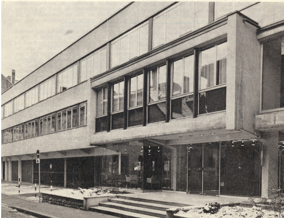
Rectorat de l'académie de Strasbourg. Façade nord, rue de la Toussaint.

— Le 4 e bureau, en ce qui concerne les personnels de l'Administration académi-