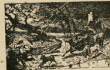
FIG. 181. — L'orage.

3. — Les éclairs et le tonnerre. — La pluie qui tombe en été est accompagnée d'autres phénomènes. Au moment des orages, le ciel est sillonné par des éclairs accompagnés de tonnerre.