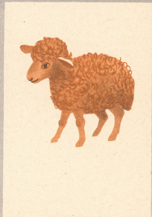
L'alène et ses amis