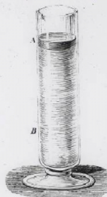
Lait en repos surmonté d'une couche de crème.