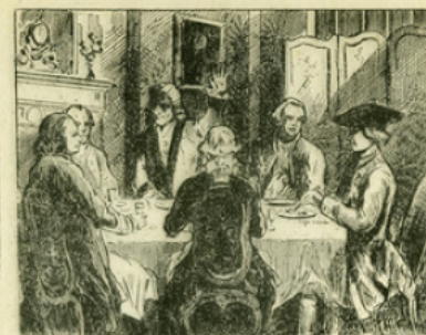
Fig. 8. — Franklin à la table de Voltaire, d'après une gravure de 1776.