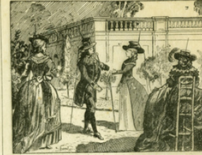
Fig. 9. — Pour honorer une des inventions de Franklin (le paratonnerre), la mode fut quelque temps, à Paris, vers 1778, de porter des chapeaux garnis, autour de la ganse, d'un fil métallique terminé en pointe et se prolongeant jusqu'en soi par une chaîne d'argent.