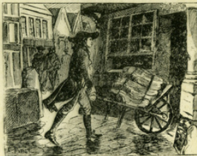
Fig. 2. — Franklin avait des principes d'ordre et d'économie qu'il appliquait aux moindres détails de sa vie : il aimait à transporter lui-même le papier nécessaire aux travaux de son imprimerie.