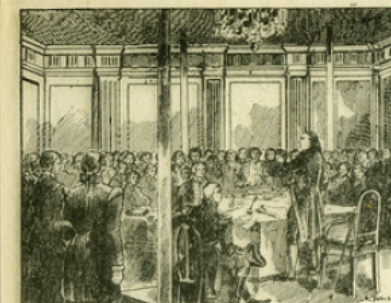
Fig. 7. — Franklin au Congrès de Philadelphie, où fut proclamée l'indépendance des États-Unis, le 4 juillet 1776.