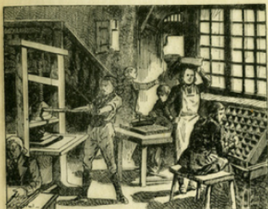
Fig. 1. — La jeunesse de Franklin se passa chez son frère aîné, qui était imprimeur à Boston.