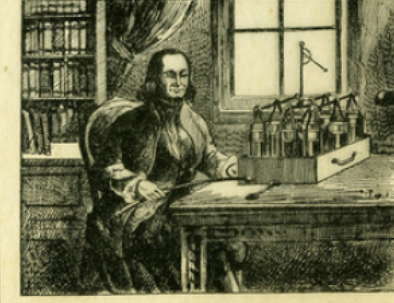
Fig. 6. — Première batterie électrique, inventée par Franklin (d'après une gravure du livre de Barbeu-Dubourg qui a traduit les œuvres de Franklin en 1773).