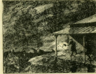
Fig. 3. — A Philadelphie, en 1750, Franklin se servait d'un cerf-volant pour étudier l'électricité des nuages et ses effets.