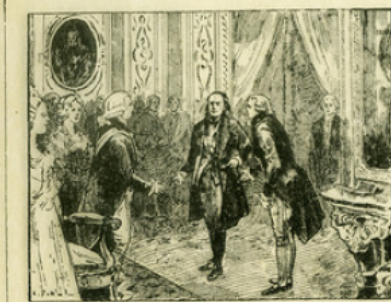
Fig. 10. — Franklin, ambassadeur des États-Unis d'Amérique, est reçu par Louis XVI en 1778.