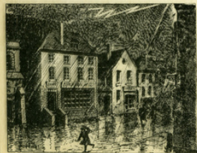
Fig. 4. — C'est à Philadelphie, en 1760, que Franklin installa le premier paratonnerre, sur la maison du banquier Benjamin West.