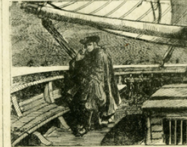
Fig. 11. — Franklin retourne en Amérique ; du pont du navire, il étudie la marche du courant du Gulf-Stream.