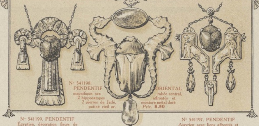
N° 541198. PENDENTIF magnifique sca 2 hippocamps 2 pierres de Jade, patiné vieil or.