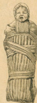
Maillot en usage en Bretagne