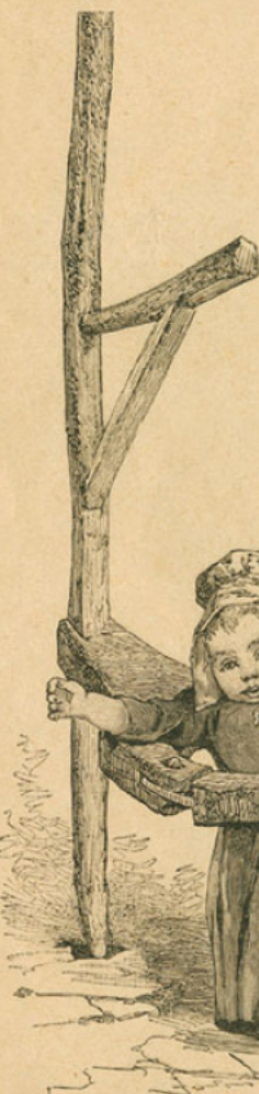
Le viroulet, tourniquet pour la garde des enfants