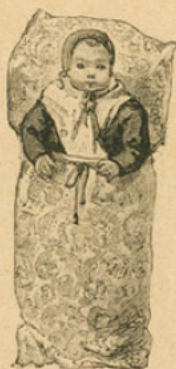
Nourrisson des provinces lorraines