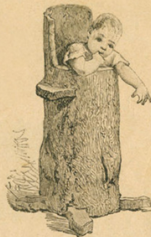
Tronc d'arbre évidé, en usage dans la Gironde pour l'éducation des nourrissons