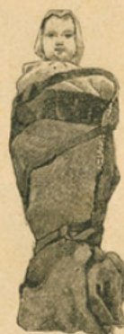
Maillot en usage dans les Basses-Pyrénées