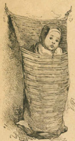
Nourrisson dans un sac, suspendu à un mur