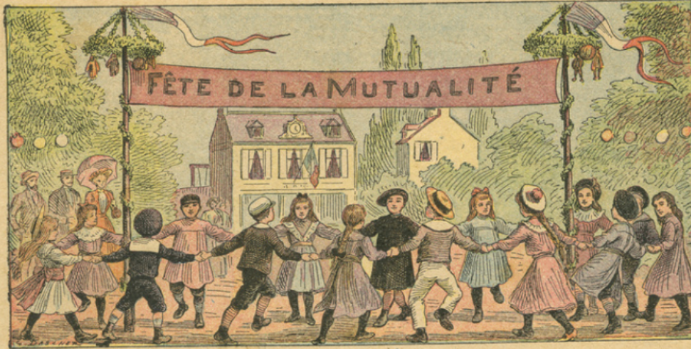
N° 9. — LA MUTUALITÉ EN FRANCE.

Les sociétés de secours mutuels ont pour but de venir en aide à ceux qui, par suite d'un accident, d'une maladie ou de toute autre éventualité, déterminée dans les statuts de l'association, sont privés des fruits de leur travail quotidien. La Fédération nationale mutualiste groupe toutes les sociétés françaises de secours mutuels en un faisceau compact de 17.500 sociétés comprenant 3 millions et demi de membres, dont l'extension continue résout le grand problème de la réduction des risques. L' "Union pour la vie", telle est la devise des mutualistes.