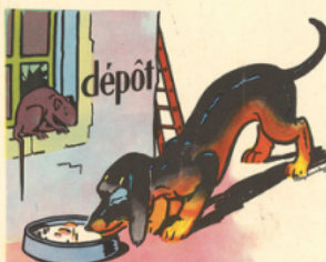
to bi di ne - un ra! rô de