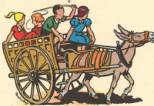
ca di tire la ca rri o le