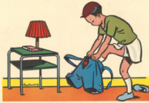
ré mi met la cu lo tte