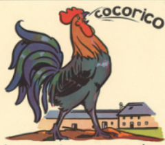
le coq chante co co ri co