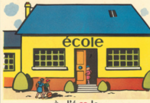
à l'é co le

co ca cu ca ro cu na co da ca un é cu - u ne ca le - de la co lle - - u ne co lo nne - du ma ca ro ni -