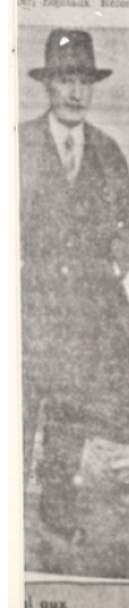
Notre photo représente un coin du Foyer de l'École normale tel qu'il était aux moments de détente.