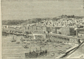
Port d'Alger. — Alger a été conquis en 1850. C'est le chef-lieu du département d'Alger, et la résidence du gouverneur général de l'Algérie.

cousin Vertamboz, il y avait beaucoup de cultivateurs français qui allaient s'établir en Algérie en qualité de colons. Au moment où ils débarquèrent sur les quais d'Alger (fig.), on leur donna avis que, le lendemain même, un explorateur célèbre, qui connaissait à fond l'Algérie, leur ferait une conférence pour les familiariser un peu avec leur nouveau pays. Presque tous se rendirent à cet appel, et, comme la conférence était publique, M. Vertamboz ne se fit pas faute d'y assister avec Yves Gloanec. L'orateur était un de ces explorateurs savants et courageux dont les journaux ont beaucoup parlé dans ces derniers temps. Sa réputation, son air à la fois énergique et doux, sa voix cordiale et chaleureuse, lui conquirent dès l'abord la sympathie de son auditoire.