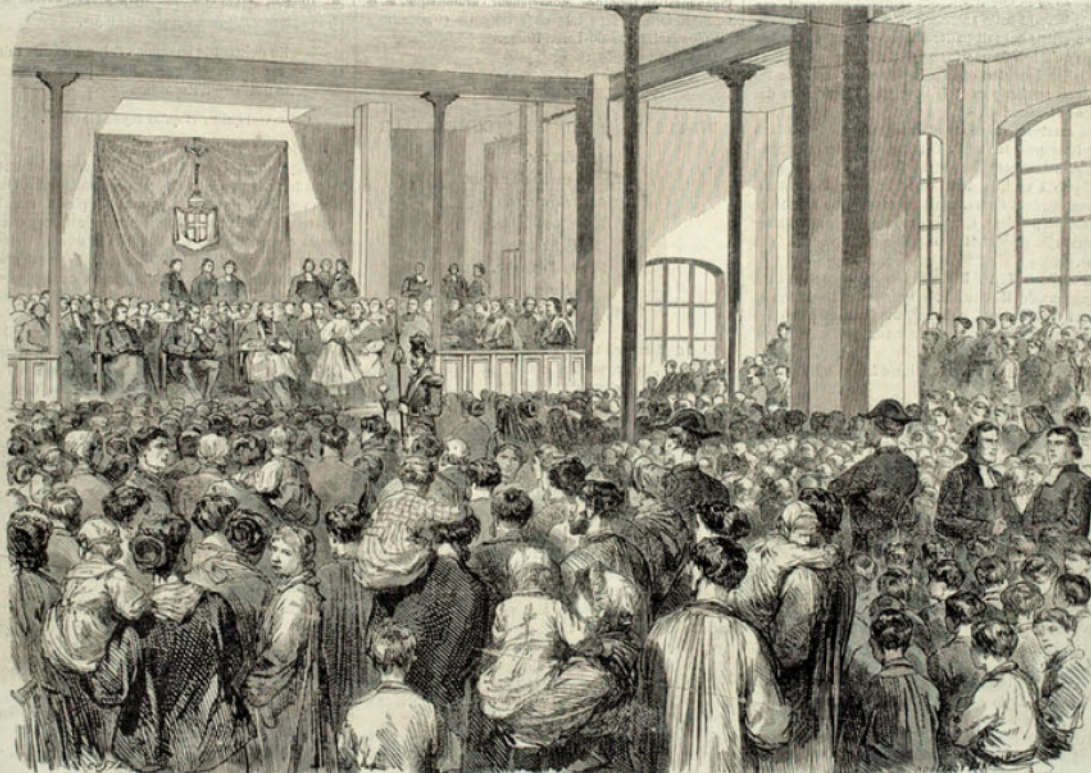
PARIS. — Inauguration, dans le préau couvert, des écoles du boulevard des Amandiers.