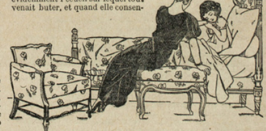
Elle saisit la main de la jeune femme.