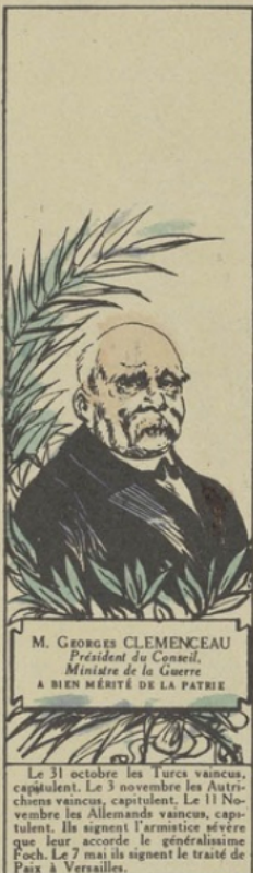
M. GEORGES CLEMENCEAU Président du Conseil, Ministre de la Guerre A BIEN MÉRITÉ DE LA PATRIE