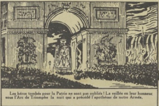
Les héros tombés pour la Patrie ne sont pas oubliés ! La veillée en leur honneur sous l'Arc de Triomphe la nuit qui a précédé l'apothéose de notre Armée.

Sous la haute présidence de ce grand patriote, le gouvernement de la Défense Nationale, a pu prendre les responsabilités qu'exigeait la situation, pour la régénération de l'Europe.