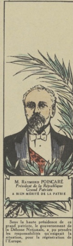
M. RAYMOND POINCARÉ Président de la République Grand Patriote A BIEN MÉRITÉ DE LA PATRIE

Sous la haute présidence de ce grand patriote, le gouvernement de la Défense Nationale, a pu prendre les responsabilités qu'exigeait la situation, pour la régénération de l'Europe.