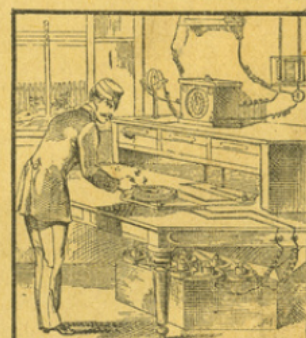
LE TÉLÉGRAPHE ÉLECTRIQUE