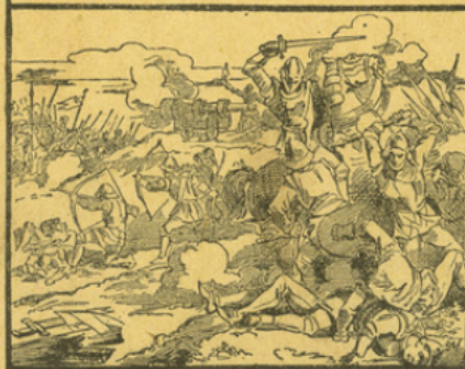
LA POUDRE A CANON