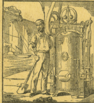
LES MACHINES A VAPEUR