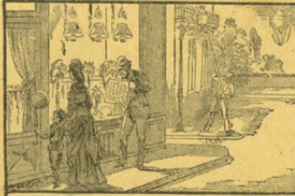
LE GAZ D'ÉCLAIRAGE