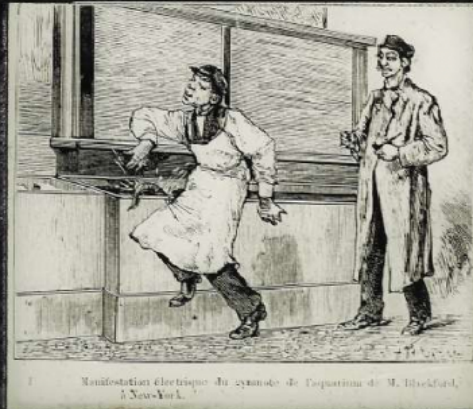
Manifstation electrique du gymnote de l'apporteur de M. Birkford, à New-York.