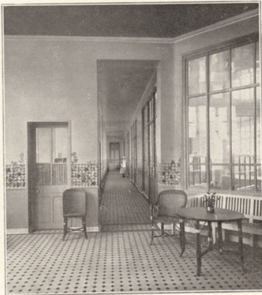
Vestibule et corridor donnant sur des chambres cloisonnées par des vitrages.

Tout bébé admis doit demeurer en observation durant vingt jours — ceci pour éviter la propagation de maladies contagieuses, déclarées ou en incubation. Chaque pensionnaire jouit d'une petite cellule entièrement vitrée, meublée, outre le lit, d'une baignoire, d'un lavabo et d'une balance.