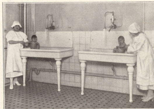
La toilette des bébés.

Signalons, enfin, pour être complet, les services généraux.