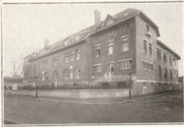
Le centre d'hygiène infantile de la Grande-Jatte.