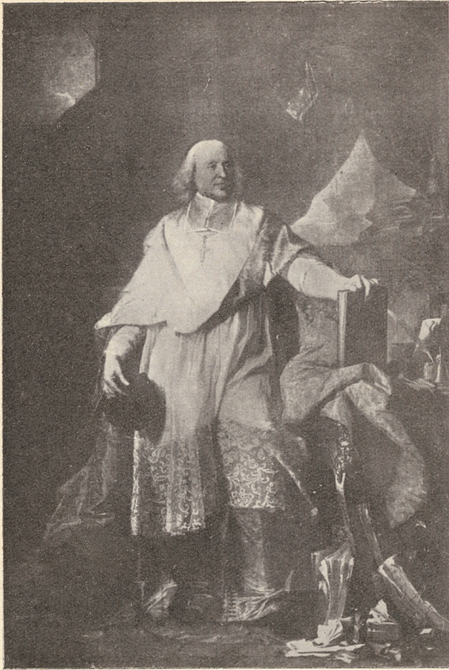
FIG. 6. — Un adversaire de Molière : Bossuet, par RIGAUD. (Musée du Louvre.)

Un de « ces dévots irréprochables » dans l'esprit desquels Molière lui-même fut perdu (cf. Notice , § V).