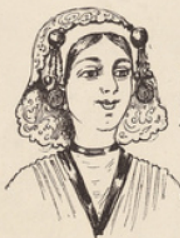
Coiffure hollandaise No. 2