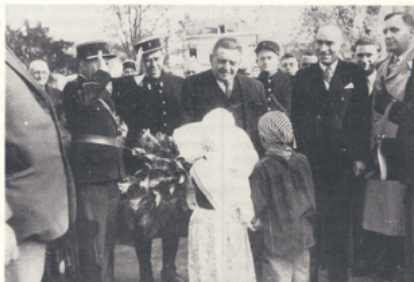
Pose de la première pierre de l'Ecole Maternelle « PAPE - CARPANTIER » par le Président Edouard HERRIOT (3 mai 1930).

L'amour qu'André MARIE avait voué aux écrivains, aux artistes du XVII ème siècle et à son architecture était profondément lié à l'environnement même, comme on dit aujourd'hui, qui favorise à l'âge de l'adolescence, l'épanouissement intellectuel du parfait humaniste qu'il fut dès ce temps-là et qu'il demeura tout au long de sa vie. Du, André MARIE fut favorisé, comme tant d'autres Rouennais avant et après lui, comme tant d'autres de sa génération, pour avoir remis ses pas de lycéen dans les pas mêmes des garçons de son âge qui, trois siècles avant lui, s'acheminaient aux mêmes heures, vers les mêmes salles de classe pour y être initiés aux mystères de la tragédie grecque, de la philosophie de PLATON, de l'éloquence de DEMOSTHÈNE et de CICÉRON. Dans le même cadre du lycée CORNÉILLE, jadis collège royal où Pierre et Thomas CORNÉILLE avaient appris des Jésuites le grec et le latin, André MARIE apprit des maîtres laïcs qui leur avaient succédé, à connaître, à aimer les mêmes œuvres, à leur arracher leurs secrets. Et il s'éprit en même temps de ce que ses prédécesseurs avaient à leur tour, et dans ce sillage, créé. DESCARTES avait connu même initia-