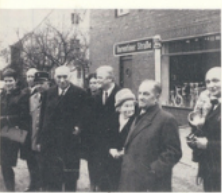
Inauguration de la BARENTINER STRASSE à WARENDORF - Le D r KLUCK, maire de Warendorf et le Président MARIE.

ANDRÉ MARIE Discours lors du vernissage de l'exposition des travaux d'élèves de l'Ecole des Beaux-Arts de Rouen (1952).