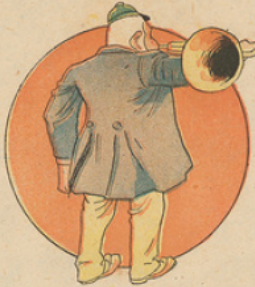
Monsieur Louziès passe toutes ses journées à jouer du cor. Il aime beaucoup cet instrument; et comme il n'est pas égoïste, il ouvre toutes ses fenêtres, afin de faire bénéficier les voisins de ses harmonieux accords.