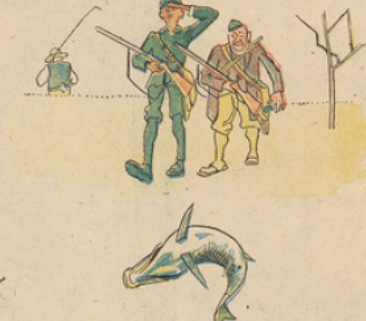
Lorsque nos deux chasseurs, plus bredouilles que jamais, débouchèrent d'un champ voisin. « Ça remue! », s'écrièrent-ils tout à coup.