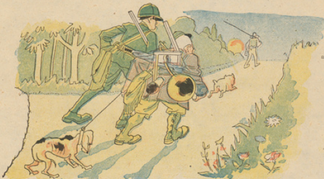
Enfin, le jour de l'ouverture est arrivé. A quatre heures du matin, nos deux héros se mettent en route. A quelque distance devant eux marche le sieur Dumont, un grand pêcheur à la ligne devant l'Eternel.