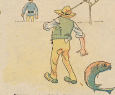
Mais apercevant au loin la silhouette du garde-champêtre, il jeta la carpe encore toute vivante dans un champ, pensant la reprendre après le passage du garde, et continua son chemin.