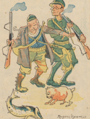
Nos deux chasseurs, qui étaient très étonnés d'avoir tué quelque chose, le furent encore bien davantage en s'apercevant qu'ils venaient de tuer une carpe, et que cette carpe restait encore.