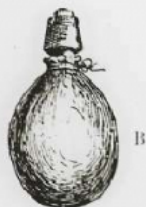
— A, tube à deux pavillons, dont l'un entre dans l'estomac, tandis que l'autre sort à la surface de la peau ; B, sac en caoutchouc qu'on adapte au tube pour recevoir le liquide.