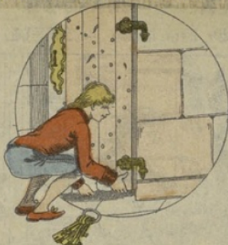
Un jour, ne pouvant pénétrer dans une maison avec de fausses clefs, il soulève la porte par le dessous pour la faire sortir de ses gonds.