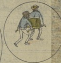
S'étant éveillés, les porteurs trouvent le brancard chargé et l'emportent à destination.