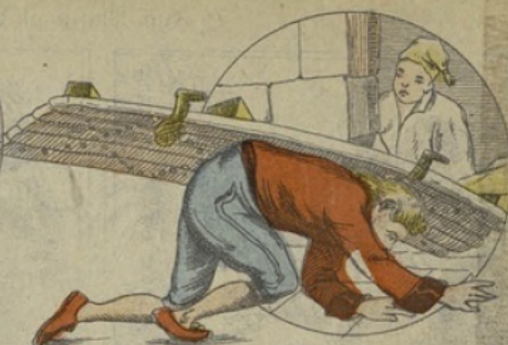
Mais la porte est si lourde qu'elle tombe sur lui et il ne peut se relever. Il se traîne en faisant des efforts désespérés, chargé de la porte dont les clous restent attachés à ses habits.