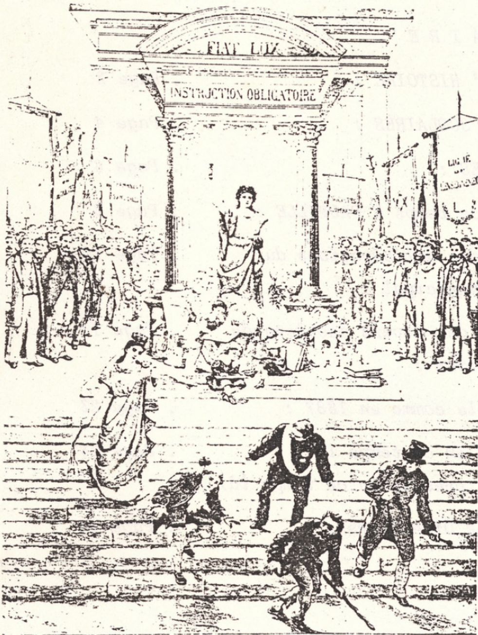
L'INSTRUCTION, C'EST LA LUMIÈRE.