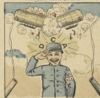
Aucun Zepp'lin ne rentrera Grâce à ton œil très vigilant.