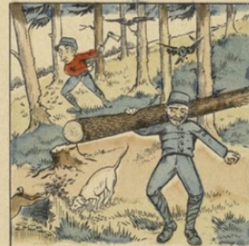
A tout métier l'assimil'ras, Celui d'bôch'ron inclusiv'ment.