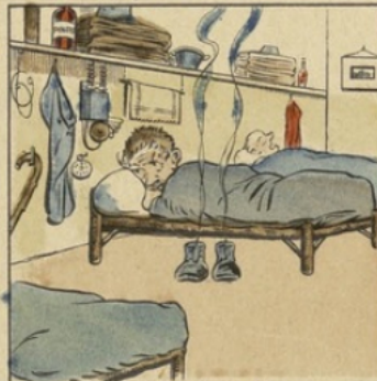
A la sonnet' te réveill'ras Pour prendr' ta gard' joyeusement.