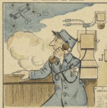
L'avion enn'mi tu signal'ras Pour qu'on l'abatte rapid'ment.