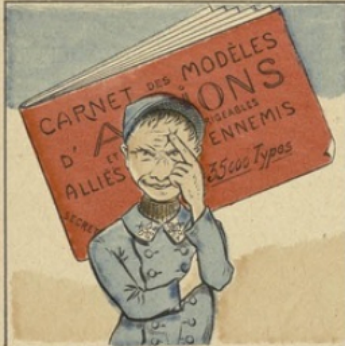
Tous les avions tu connaîtras, Alliés et Boch's, parfaitement.

IMAGERIE D'ÉPINAL, N° 98 me FELLERIN et C o , imp.-édit.