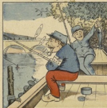
L'Ordinaire amélioreras En utilisant tes talents.