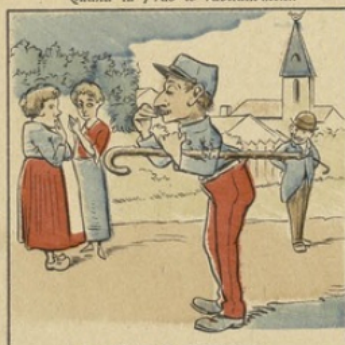
A la vill' tu te distingu'ras Par ta tenue et tes mouv'ments.