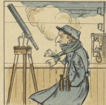
Au mirador tu guetteras, Le jour, la nuit, par tous les temps.