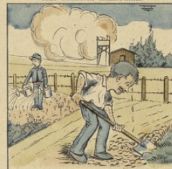
Un jardin tu cultiveras Pour vivre économiquement.