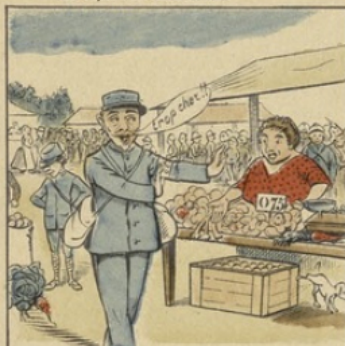
Très intéressé l'montreras Quand tu f'ras le ravitaillement.