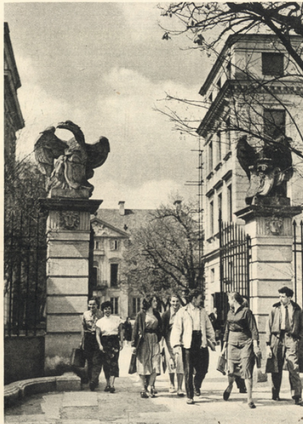
DEVANT L'ACADEMIE DES BEAUX-ARTS A VARSOVIE.

Avant la guerre, Lodz, grand centre de l'industrie textile polonaise, n'avait qu'une seule école supérieure avec 523 étudiants. Encore n'était-ce qu'une filiale et non une école entièrement indépendante. Aujourd'hui, Lodz compte 10 écoles supérieures fréquentées par près de 15.000 étudiants. Cracovie, le plus ancien centre universitaire de Pologne, aux riches traditions culturelles, comptait en 1954/55, 12 écoles supérieures avec 21.538 étudiants contre 4 en 1937/38 avec 7.500 étudiants. Poznan, qui fut depuis longtemps un centre culturel important, a vu le nombre de ses écoles supérieures passer de 4 en 1937/38 à 9 en 1954/55 et le nombre de ses étudiants de 6.092 à 13.218. Wrocław est devenu en Pologne