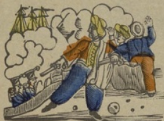
Algerien A Algerien. a e i o u j (Voyelles.)