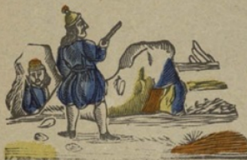
Grees G Grieken. Gs ge gi go gu.