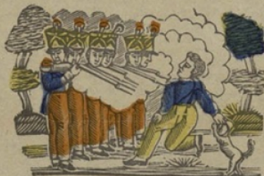
Executio militaire. E Executie (militaire.) la voyelle E.