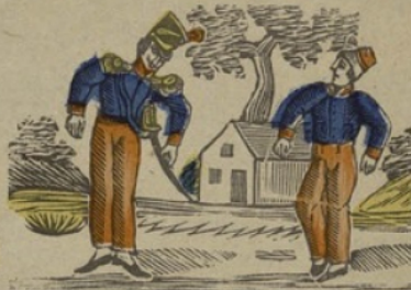
Jean Paot. J Johan Paot. Ja je ji jo ju, la voyelle I.