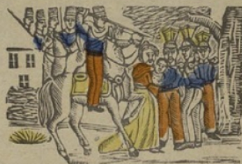
Cosakken C * Cosaques. Ca ce ci co cu.