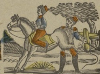
Leou d'équitation. L Les la rijden La le li lo lu.