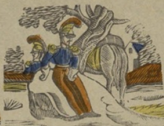
Halte H Halte. Ha he hi ho hu.