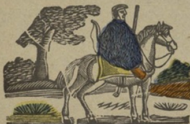
Kalmoue K Kalmoue. Ka ke ki ko ku.