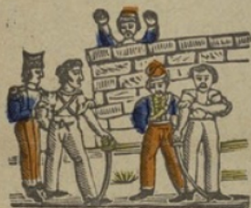
Duel... D Duel. Da de di do du.