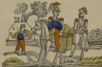
Fourageurs F Fourgeurs. Fa fe fi fo fu.