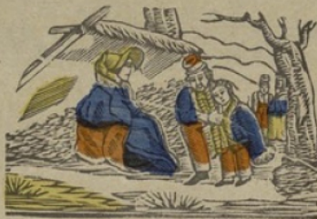
Bivak B Bivouac. Ba be bi bo bu.