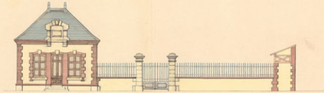
Façade sur la rue.