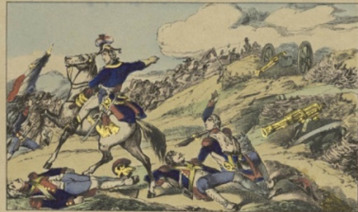
Hoche à Wissembourg repoussant l'invasion de l'Alsace.

Les Autrichiens et les Anglais avaient envahi le département du Nord. Carnot, après avoir organisé l'ensemble de la défense nationale, va prendre la direction de notre armée du Nord, que commandait Jourdan. Les 15 et 16 octobre 1793, Carnot et Jourdan attaquent l'ennemi établi dans la forte position de Wattignies. Repoussés une première fois, ils reviennent à la charge : une masse de cavalerie renverse notre avant-garde ; Carnot, descend de cheval, se met à la tête de notre infanterie, le fusil en main, et la ramène à l'ennemi. La cavalerie autrichienne est balayée, la position est emportée, et cette journée commence la série de nos victoires.