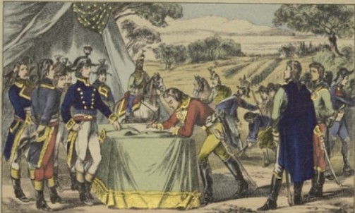
Le général Hoche pacifiant la Vendée.

Les Prussiens et les Autrichiens avaient envahi l'Alsace. Le général Hoche, envoyé par Carnot, tourne les Prussiens, descend à travers les glaciers et les neiges des Vosges, sur le flanc des Autrichiens. Le 22 décembre 1793, il emporte d'assaut les redoutes autrichiennes de Froeschwiler. Il bat de nouveau les Autrichiens à Worch, puis à Sossitz. Les deux armées autrichiennes et prussiennes se réunissent. Hoche les attaque sur toute la ligne du Rhin aux Vosges. Le 20 décembre, il culbute ses hostiles ennemis qui défendent la hauteur du Gelsberg, en avant de Wissembourg et rejette les Prussiens et les Autrichiens au-delà des lignes de Wissembourg et de Landau. Le territoire français est délivré par l'armée de la République, dans ces mêmes lieux où une autre armée française, aussi brava, mais moins heureuse, devait un jour succomber par la suite du second Empire.