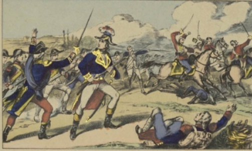
Carnot à Wattignies repoussant l'invasion de la Flandre.

Les Autrichiens et les Anglais avaient envahi le département du Nord. Carnot, après avoir organisé l'ensemble de la défense nationale, va prendre la direction de notre armée du Nord, que commandait Jourdan. Les 15 et 16 octobre 1793, Carnot et Jourdan attaquent l'ennemi établi dans la forte position de Wattignies. Repoussés une première fois, ils reviennent à la charge : une masse de cavalerie renverse notre avant-garde ; Carnot, descend de cheval, se met à la tête de notre infanterie, le fusil en main, et la ramène à l'ennemi. La cavalerie autrichienne est balayée, la position est emportée, et cette journée commence la série de nos victoires.