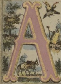
ANVOISIR, ANÈS, AIGLE, ARBRE.