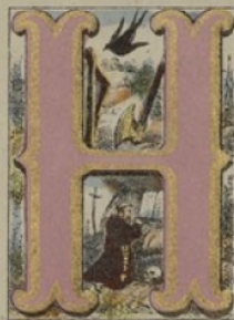
HIRONDELLE, HACHE, HARPE, HERMITE.