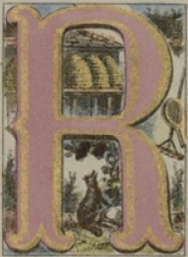
RENARD, RUCHE, RATAUD, RAQUETTE.