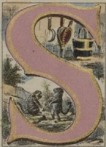
SINGES, SEAU, SOUFFLET, SERPETTE.