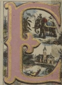
ÉLÉPHANT, ERMITAGE, ESCARBOT.