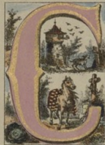
CHEN, CHEVAL, CHOUX, COLOMBIER.