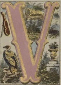
VAUTOUR, VASE, VIOLON, VERVEUX.