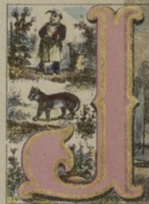
JARDINIER, JAGUAR, JET D'EAU.