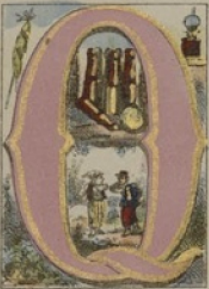
QUILLE, QUILLER, QUINQUET, QUINGILLE.