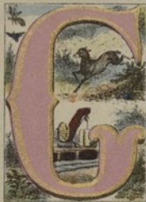
GAZELLE, CRUE, QUÈPES.