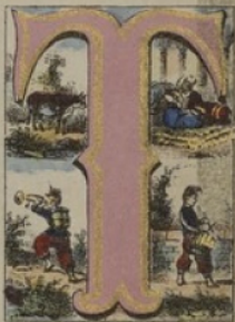
TAMBOUR, THOMPETTE, TUNC, TAUREAU.