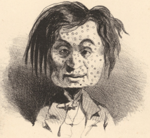
Il doit en outre justifier d'un certificat de vaccine - Le certificat n'est pas exigé dans le cas ci-dessus.