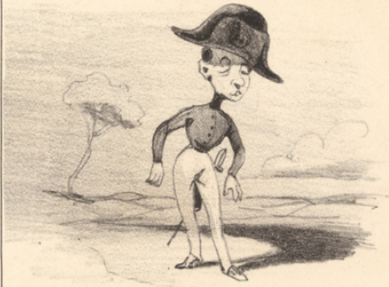
Le premier soin du candidat reçu est d'endosser le costume et de prendre l'air napoléonien.