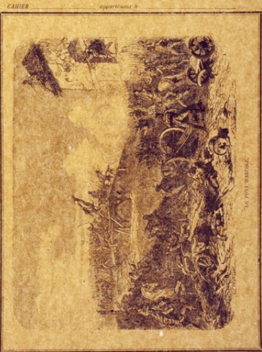
LE PONT D'ARCOLE.

Paris. — Imp. Goussier-Vivier, au quai des Grands-Augustins