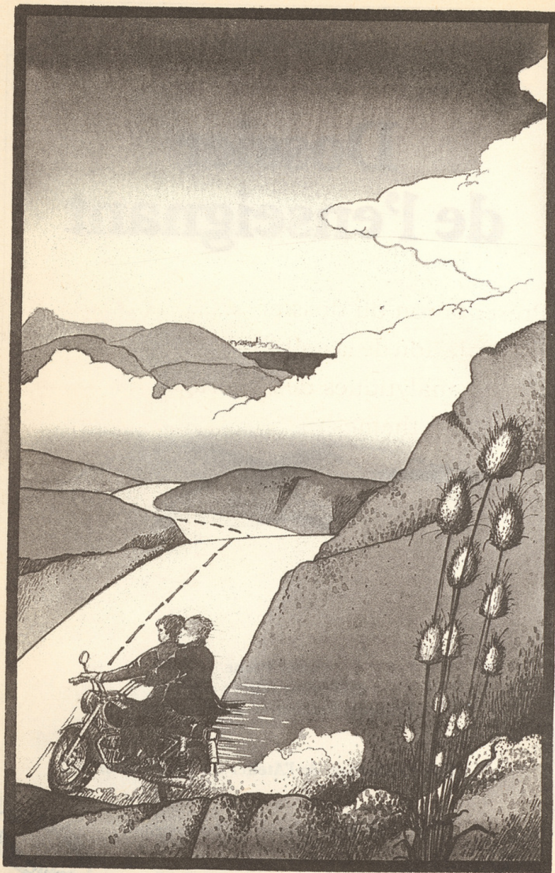
Illustration de Gérard Franquin