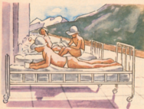
Traitement de la tuberculose des os, des articulations, des glandes, du péricrâne, dans un sanatorium.